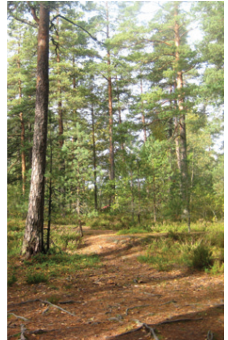
Mankkaan alueelle ominainen luonnonläheisyys ei tulevaisuudessa ole mikään itsestäänselvyys.

Vilkaassa keskustelussa asukkaat esittivät huolensa etenkin liikenteen sujuvuudesta, luonnon katoamisesta ja koko Mankkaan alueen luonteen täydellisestä muuttumisesta. Liikenteen osalta on suunnitelmia, mutta ne eivät ole toteutumassa ennen kuin vuosien päästä. Sitä ennen uusien rakennusten valmistumisen myötä kuormitus Mankkaan nykyisillä kaduilla kasvaa väijäämättä. Sekä Lukukallion metsä mutta etenkin Jukolanahteen päästä alkava metsä ovat olleet mankkaalaisille varsin suosittuja ulkoilumaastoja, jopa sienestys- ja marjastuspaikkoja, mutta nyt suuri osa tästä alueesta ollaan tuhoamassa. Lisäksi mankkaalaiset ovat hankkineet asuntonsa tai talonsa nimenomaan luonnonläheiseltä pientaloalueelta, mutta tilanne ei ole enää jatkossa sama. Tiedossa kun ei edes ole kuinka suuri osa suunnitelluista korkeista kerrostaloista on mahdollisesti kaupungin vuokratiloja. Tilaisuuden osanottajat eivät myöskään olleet lainkaan innostuneita projektista vastaavien henkilöiden monta kertaa mainostamasta Suurpeltoon tulevasta kauppa-alueesta, sehän on epäkäytännöllisesti väärällä puolella kehä kakkosta.